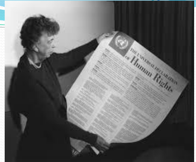
Елеонора Рузвельт і Загальна декларація прав людини

Міжнародні документи складають дуже важливу частину правової основи професійної етики поліцейських.