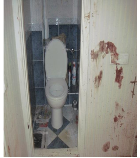
Помарки та мазки