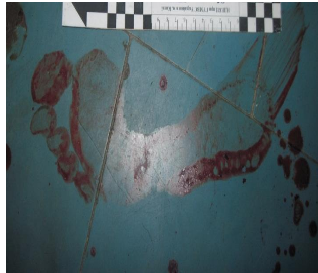
Відбитки пальців, підшов